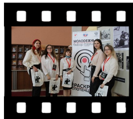
Фото участников дискуссии «Молодёжный выбор 2021»